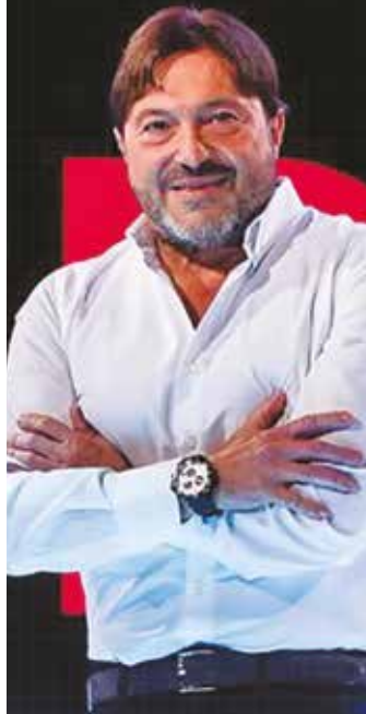
SIGFRIDO RANUCCI 29 settembre, ore 18.00