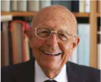
SABINO CASSESE 28 settembre, ore 18.30