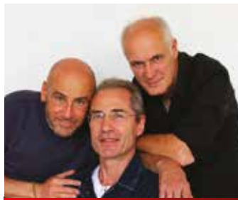
TEATRO INCERTO 27 settembre, ore 21.00