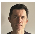
Davide Marazzi - Marazzi Architetti BOSCO DELLO SPORT DI VENEZIA E NUOVO PALASPORT DI CAGLIARI