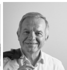
Lotti + Pavarani Architetti, Tassoni and Partners, Studio LSA PARCO ARENA CAMPOVOLO, PEDESTRIAN BRIDGE E MASTERPLAN PARCO DELLO SPORT DI REGGIO EMILIA